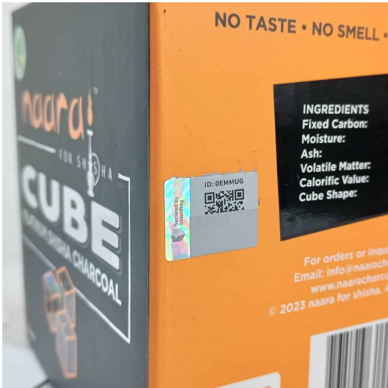
Pegatinas con holograma en el lateral de la caja