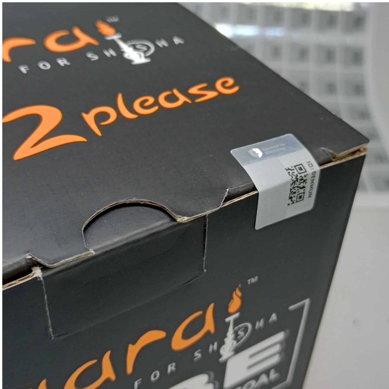
Hologramm-Aufkleber auf der oberen Deckelabdeckung und der Seitenwand der Shisha-Kohlebox

Alle Aufkleber können mit Ihrem Markendesign angefertigt werden. Die Größe der Aufkleber ist flexibel, aber wir verwenden normalerweise 2 x 1,5 cm und 3 x 2,5 cm. Die Mindestbestellmenge beträgt 25 Tausend Stück. Alle Aufkleber werden in einer professionellen, auf Hologrammschutz spezialisierten Druckerei gedruckt. Die Druckzeit für die nicht markengeschützten Aufkleber beträgt 5 Tage und für die markengeschützten Aufkleber 35 Tage.